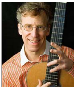
Eliot Fisk, guitarrista estadounidense de fama mundial, estrenará este martes "Geografía de un canto", en North Carolina.